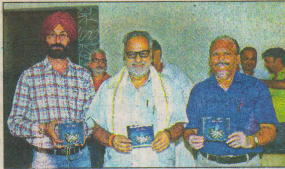
जल चालीसा गायन किया है वहीं सुन्दरता प्रदान की है। राज्यपाल ने विकास वीडियो विजन ने उसे जल चालीसा की महत्ता बताते हुए