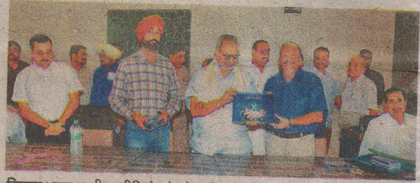
सिरसा। जल चालीसा वीडियो को लोकार्पण करते राज्यपाल प्रो. गणेशीलाल।